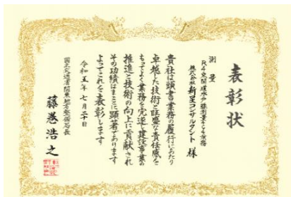
【常総国道事務所】 R4 東関道水戸線測量 4C4 業務

これからも、今以上の高品質な成果品の作成を目指し若手技術者の育成とともにさらなる向上を目指してまいります。