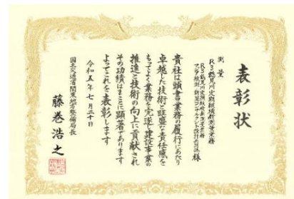
【京浜河川事務所】 R3 鶴見川定期縦横断測量業務 (JV 案件)