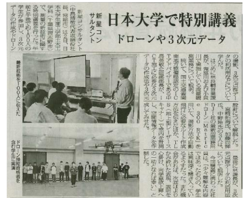
日本工業経済新聞【6/9(金)掲載】