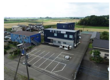
(弊社上空から UAV による撮影)