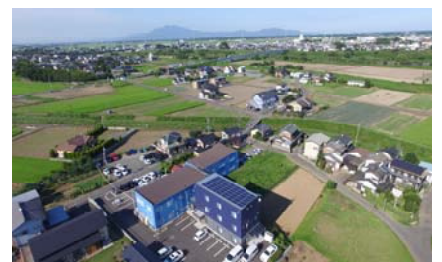
(弊社上空から UAV による撮影)