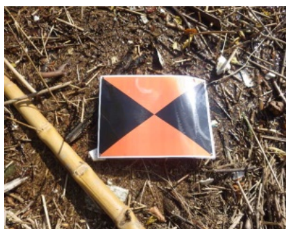
(※写真：特許証及び対空標識)