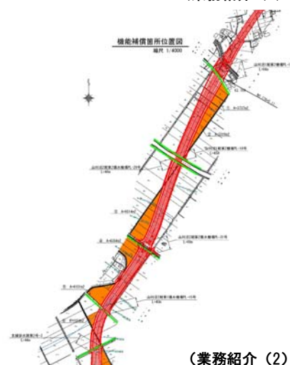
(業務紹介 (2) 位置図)

本業務は主要地方道筑西三和線バイパス（筑西幹線道路）の整備に伴い、必要となる農業用水パイプラインの詳細設計を行うものです。