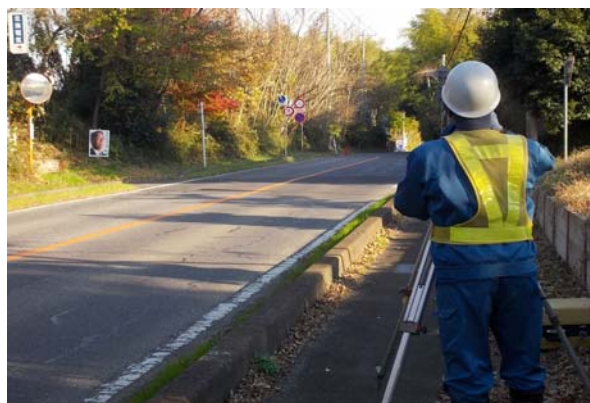
(業務紹介 (1) 作業風景)

本業務は、一般県道 取手豊岡線の道路事業について、設計及び施工を実施するための基礎資料を得ることが目的です。