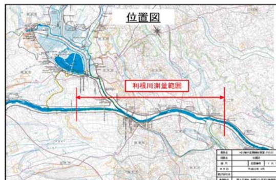
(H23 管内定期横断測量(その3))

利根川上流河川事務所様より、H23 管内定期横断測量(その3)を受注しました。本業務は、利根川上流河川事務所管内の(利根川 120.0km~136.0km)の河川定期横断測量です。