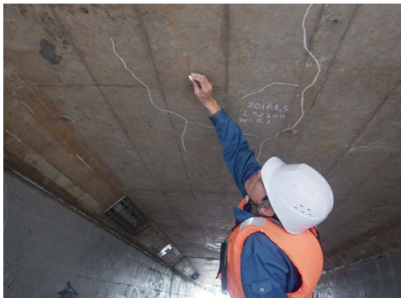
橋梁定期点検業務委託その1