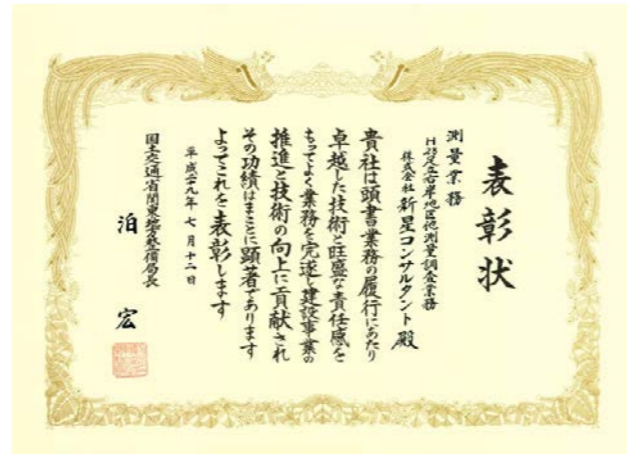
平成28年度優良業務局長表彰 国土交通省関東地方整備局荒川下流河川事務所 H28足立右岸地区他測量調査業務