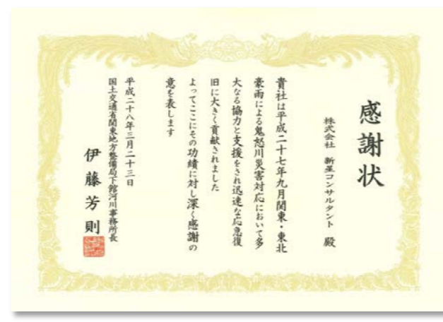
平成27年9月関東・東北豪雨による 鬼怒川災害対応 感謝状 国土交通省関東地方整備局下館河川事務所