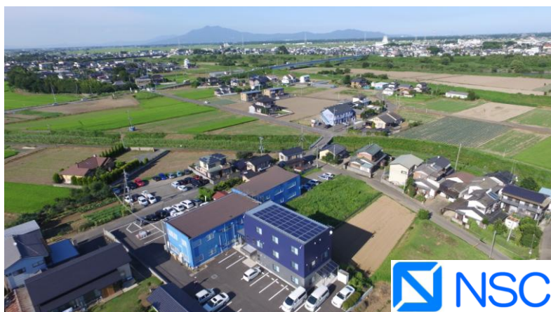
(弊社上空から UAV による撮影)